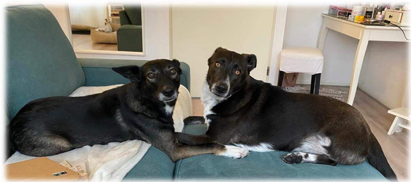
(Bert en Sofie)

De ontvangen bijdrage voor adopties (€ 35.445,--) heeft betrekking op 106 honden en 37 katten, die via de Stichting in Nederland en België zijn geplaatst. De kosten van deze plaatsingen (voor o.a. het asiel en het transport) bedroegen € 31.040,68.