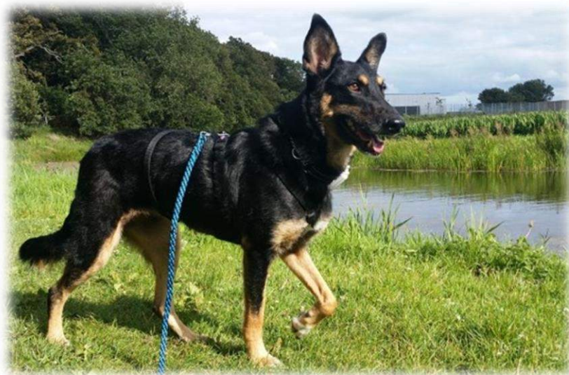
(River met veiligheidstuigje)

In 2022 zijn geen kosten meer voor de registratie van de hond of kat bij een erkende databank voor gezelschapsdieren. In 2021 is namelijk bij Petlook.nl een abonnement afgesloten met een looptijd van 5 jaar. Bij Petlook.nl kunnen de honden en katten onbeperkt aan- en afgemeld worden.